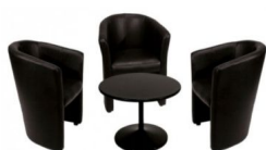
ENSEMBLE CONFORT 230€ HT