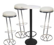
ENSEMBLE Z 185€ HT